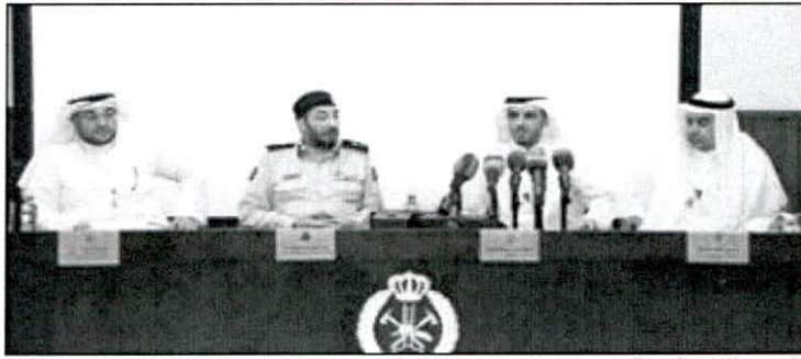
جانب من المؤتمر الصحفي

● أن يكون متفرغاً للدراسة والتدريب وفقاً للخطط واللوائح. ● أن يجتاز اختبار المقابلة الشخصية من قبل اللجنة المختصة.